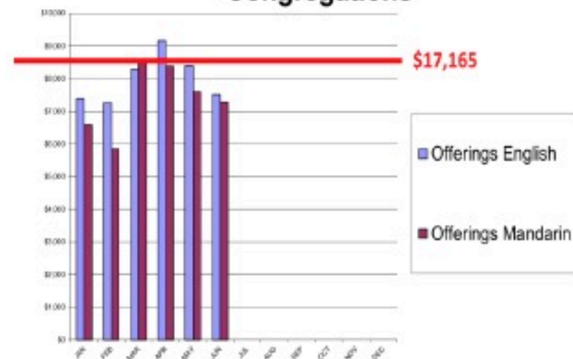
Offeratory English and Mandarin Congregations